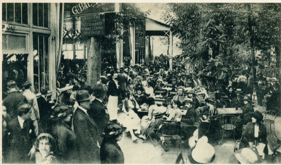
La terrasse du Pavillon Lafontaine.