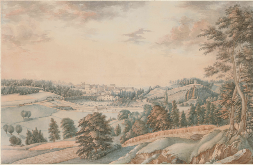
Le village du Plessis-Piquet peint par Frédéric-César de La Harpe (aquarelle, 1805).

Mentionné pour la première fois en 839 sous la dénomination latine Plessis acus bourgade entourée de palissades Le Plessis-Piquet, l'ancien nom du Plessis-Robinson,