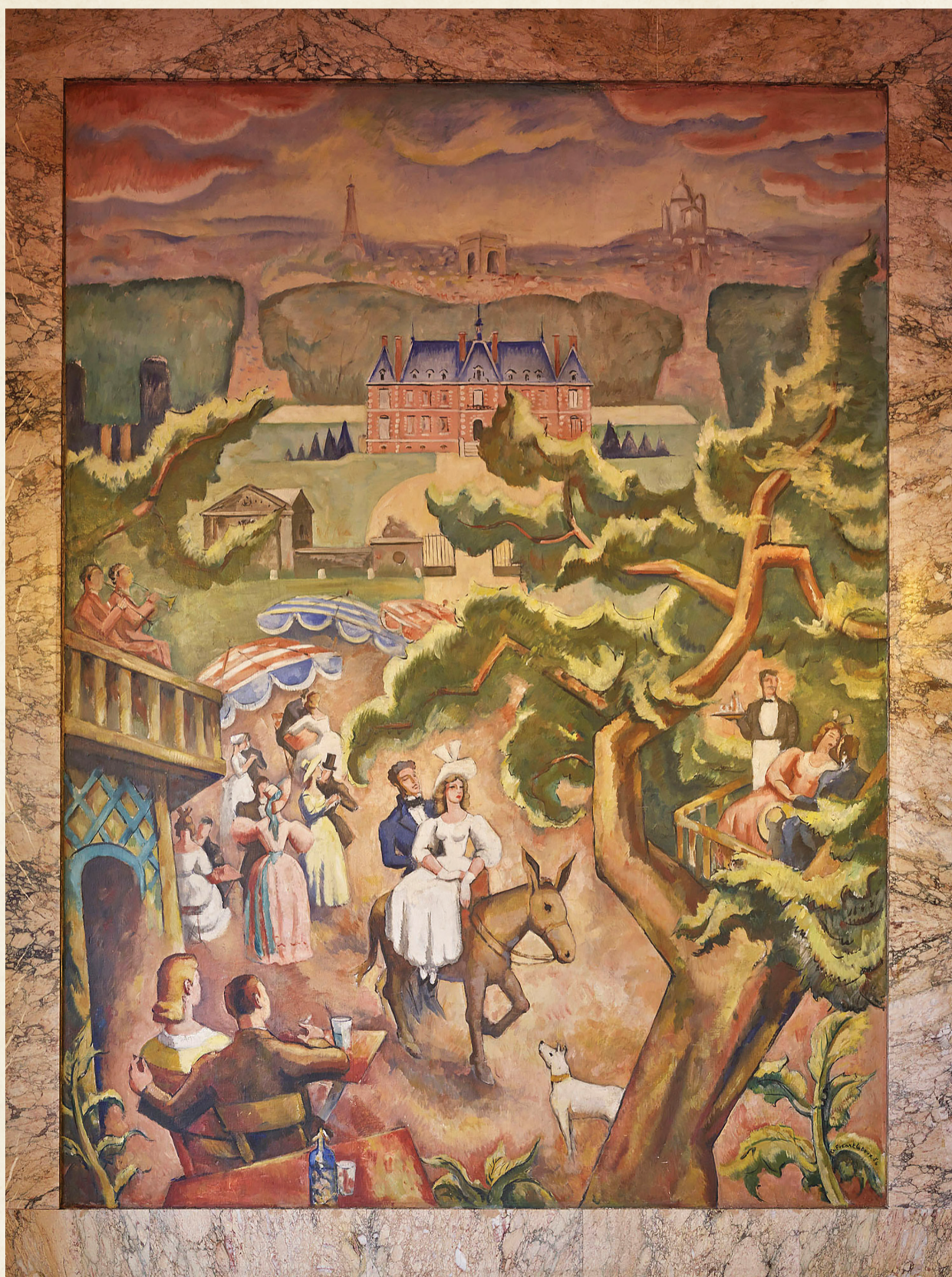
Vue du château du parc de Sceaux, par Charles Picart-Ledoux, 1956 Peinture, annexe de la mairie, 26 rue Mouton-Duvernet 75014 Paris

Comment les guinguettes ont changé l'histoire d'un petit village