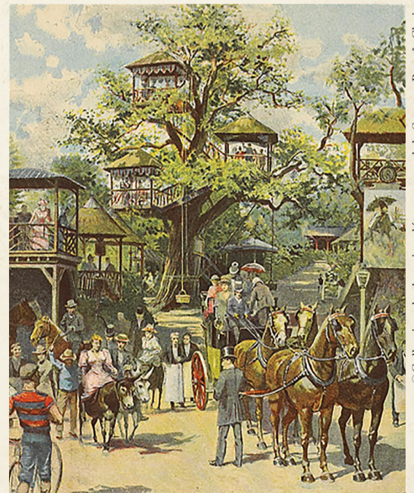
La première guinguette, Au grand Robinson , fondée en 1848. lithographie couleur sur papier.