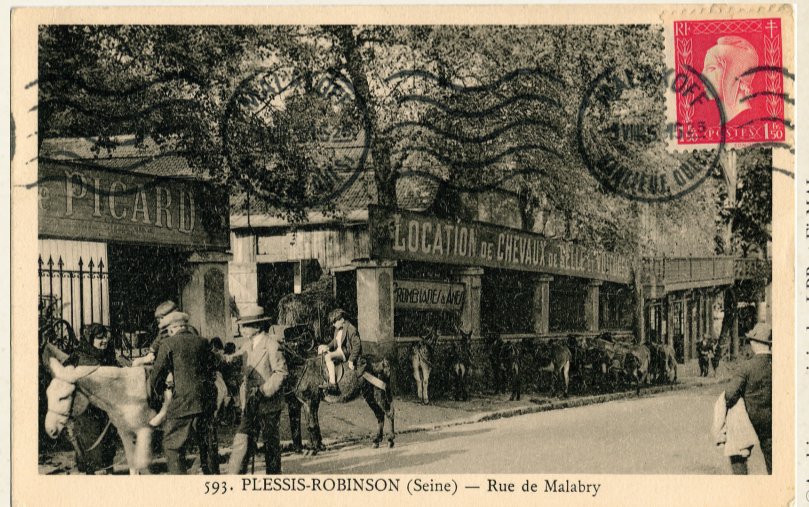
593. PLESSIS-ROBINSON (Seine) — Rue de Malabry Maison de location d'ânes Picard, rue de Malabry, après 1910.

La création des guinguettes a pour effet de partager peu à peu Le Plessis en deux localités : le Vieux Plessis et Robinson. Les deux Plessis ne sont alors reliés l'un à l'autre que par le long détour des rares chemins vicinaux.