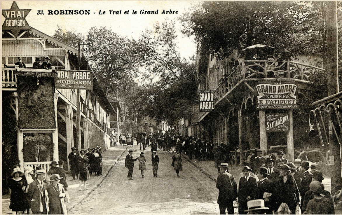
Le Vrai Arbre de Robinson, de la famille Gueusquin face au Grand Arbre, de la famille Fatiguet, vers 1900.