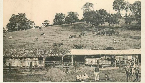
Une des cinq fermes du Plessis-Piquet.

En 1848, Le Plessis-Piquet fait partie des trois communes les moins peuplées du Département de la Seine et aurait pu avoir le destin tranquille d'une bourgade comme Marnes-la-Coquette, le dernier village des Hauts-de-Seine.