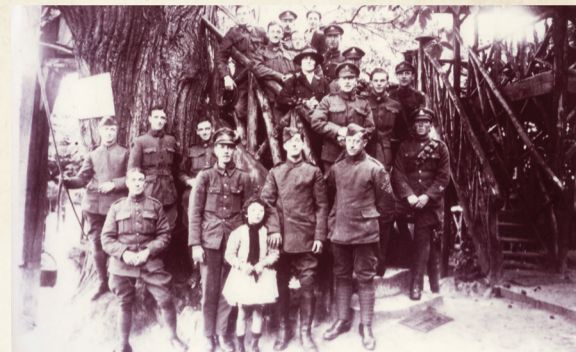
Des militaires aux guinguettes de Robinson, en 1918.

La Grande Guerre et ses conséquences auront raison de la fronde des châtelains : la famille Hachette cède sa propriété à l'Office des Habitations à Bon Marché (HBM) de la Seine, la propriété Colbert, après la fermeture du Refuge israélite qui a perdu 45 de ses jeunes dans les tranchées est démantelée et lotie. Les guinguettes de Robinson, à l'arrêt pendant quatre ans, repartent de plus belle en 1919, et s'y pressent des bataillons de militaires en goguette, en recherche de plaisirs réparateurs.