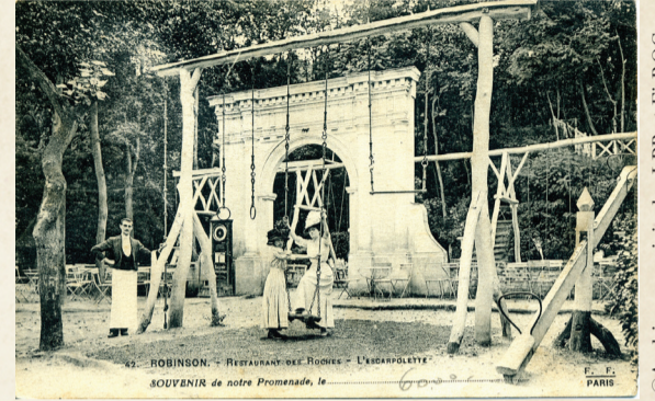
Les balançoires du Restaurant des Roches.

Le nouveau quartier grandit et la petite commune de 200 âmes en 1848 compte désormais 478 habitants en 1896. On constate également, grâce au recensement de 1896, l'apparition de nouveaux métiers, prenant le