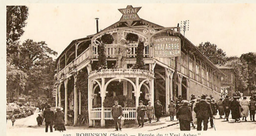
La statue de Robison Crusoe, l'enseigne du Vrai arbre de Robison.

En accolant le nom de Robinson à celui du Plessis, les élus de 1908 ont voulu associer le mythe et la marque. Robinson Crusoe, un des grands mythes de la civilisation occidentale, dont seules deux collectivités au monde se sont emparées : une île de l'archipel Juan Fernandez au large du Chili, lieu de vie du naufragé Selkirk, qui a été rebaptisée île de Robinson en 1967, et notre petite commune d'Île-de-France, qui a adopté le nom de Robinson en 1909. Un nom qui est aussi une marque commerciale : peu de gens savent où est Le Plessis, mais tout le monde connaît Robinson. Et cela a fait la prospérité de nombreux cafetiers, restaurateurs, marchands forains et autres éditeurs de cartes postales : au début du XX e siècle, la carte postée de Robinson rivalisait avec celle de la Tour Eiffel ou du Mont Saint-Michel.