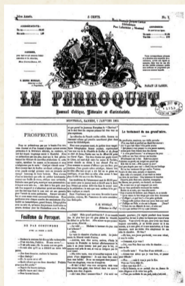
Le Perroquet , journal critique littéraire et caricaturiste.

des gens « vulgaires et bruyants » comme le public fréquentant les guinguettes. Et la résistance est féroce : les grands bourgeois financent une feuille de chou satirique, Le Perroquet qui, chaque jeudi de 1912 à 1914, tire (jusqu'à 50 000 exemplaires !) à boulets rouges sur ce maire progressiste qui veut ouvrir son boulevard de l'Union, passerelle entre l'ancien et le nouveau monde.