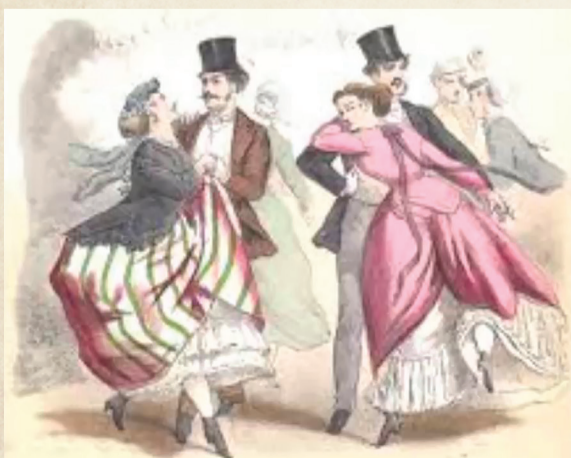
Les bals de Paris - Bals de Sceaux, par Charles Verrier.